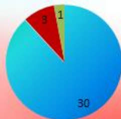
11 А класс (математический)