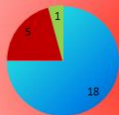
11 Б (филологический)