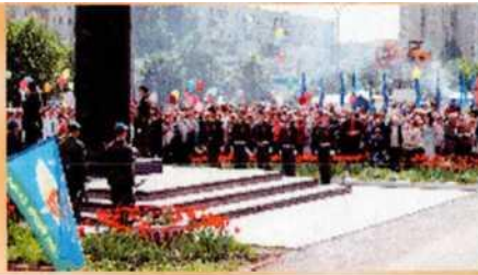
огня, обелисков, мемориалов, участие в воинских ритуалах