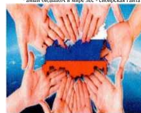
НАША РОДИНА РОССИЯ

У России самый большой в мире объем возобновляемых водных ресурсов. 44-е место в мире по объему возобновляемых водных ресурсов.