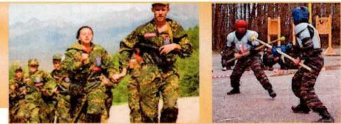
Всероссийские молодежные спартакиады по военно-прикладным видам спорта, сдача норм ГТО

Формы работы, используемые Движением, помогут молодежи в самореализации, овладении первоначальными навыками военной подготовки, физическом совершенствовании, изучении и сохранении военной истории России