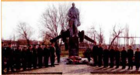
Профильные специализированные формирования юнармейцев (юных летчиков, моряков, десантников, танкистов, и другие)