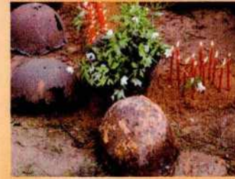
Детско-юношеские поисковые отряды