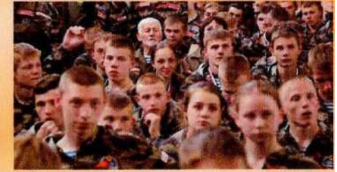
Детско-юношеские военно-патриотические, военно-