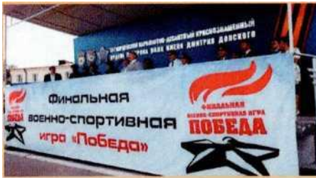
военно-патриотические игры, олимпиады, конкурсы