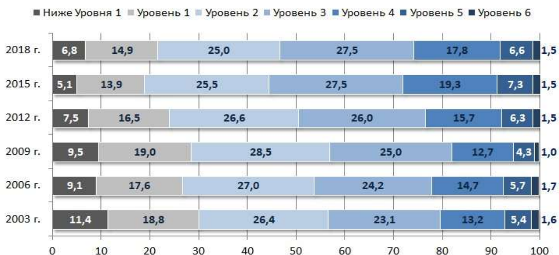
Рисунок 2. Тенденция изменения среднего балла России по математической грамотности (в %)

На Рисунке 2 представлено распределение обучающихся по уровням математической грамотности в 2003–2018 годах. В 2018 году произошло увеличение доли тех, кто получил результаты ниже порогового уровня 2 (на 2,7 %) и, соответственно, снижение доли высокоуровневых результатов на 0,7 % (уровни 4–5). Не достигли порогового уровня математической грамотности 21,7 % российских обучающихся 15-летнего возраста.