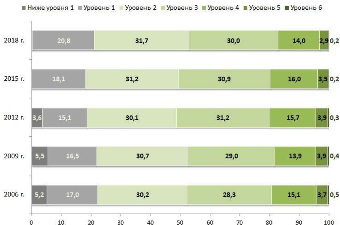
Рисунок 3. Динамика изменения распределения результатов обучающихся по уровням естественно-научной грамотности (%)

В распределении 15-летних обучающихся по уровням естественно-научной грамотности несколько увеличилось по сравнению с 2015 годом (а, точнее, вернулось к типичным для предыдущих циклов показателям) число обучающихся, не достигших порогового значения естественно-научной грамотности (2-го уровня по международной шкале) с 18 % до 21 % (Рисунок 3). При достижении данного уровня обучающиеся демонстрируют сформированность естественно-научных компетенций, позволяющих им принимать участие в различных жизненных ситуациях, связанных с естествознанием и технологиями.